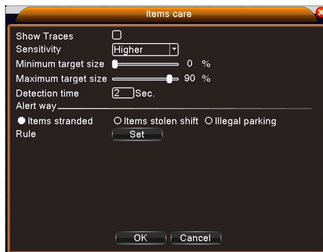
Рис 3 Установка правил – Элементы тревоги