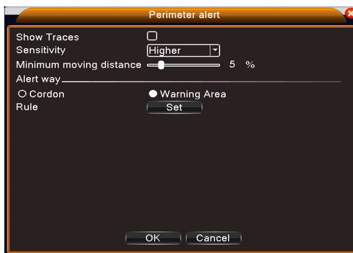
Рис 2 Настройка правила - кордон